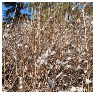
Snöbärsbuske i snö

Samling vid busshållplats Stegsholm kl 11:35. Buss 845 från Västerhaninge station 11:20.* 3 timmar, 4 km