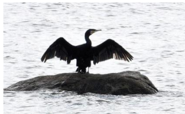
Skarv som torkar vingarna

Besök gärna vår Facebooksida " Storstockholms Naturguider " Där finns bland annat mer information om guidningarna och bilder från tidigare guidningar.