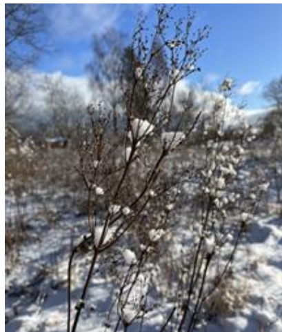
Algräs i vinterskrud